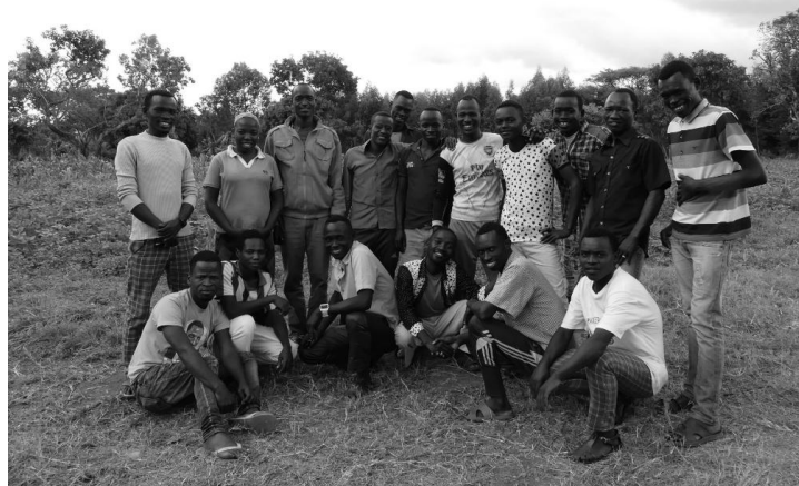
Årets 17 elever

Der er en noget bedre kommunikation mellem os lærere nu end tidligere år. I dette skoleår har vi haft en hel del lærermøder, og i begyndelsen af skoleåret blev der udarbejdet en plan for ting, der skal gøres, mål, der skal opfyldes i løbet af skoleåret. Der er blevet nedsat en skolekomite, og medlemmerne har været samlet til møde, så nu håber vi, at de tager ansvar for skolen. Jeg kunne virkelig godt tænke mig snart at se en færdigbygget afdeling for kvinder, så vi kunne få flere kvinder på bibelskole. Byggeriet til kvindeafdelingen gik i stå for godt tre år siden, da pengene slap op.