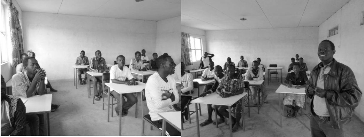
Elever i klassen