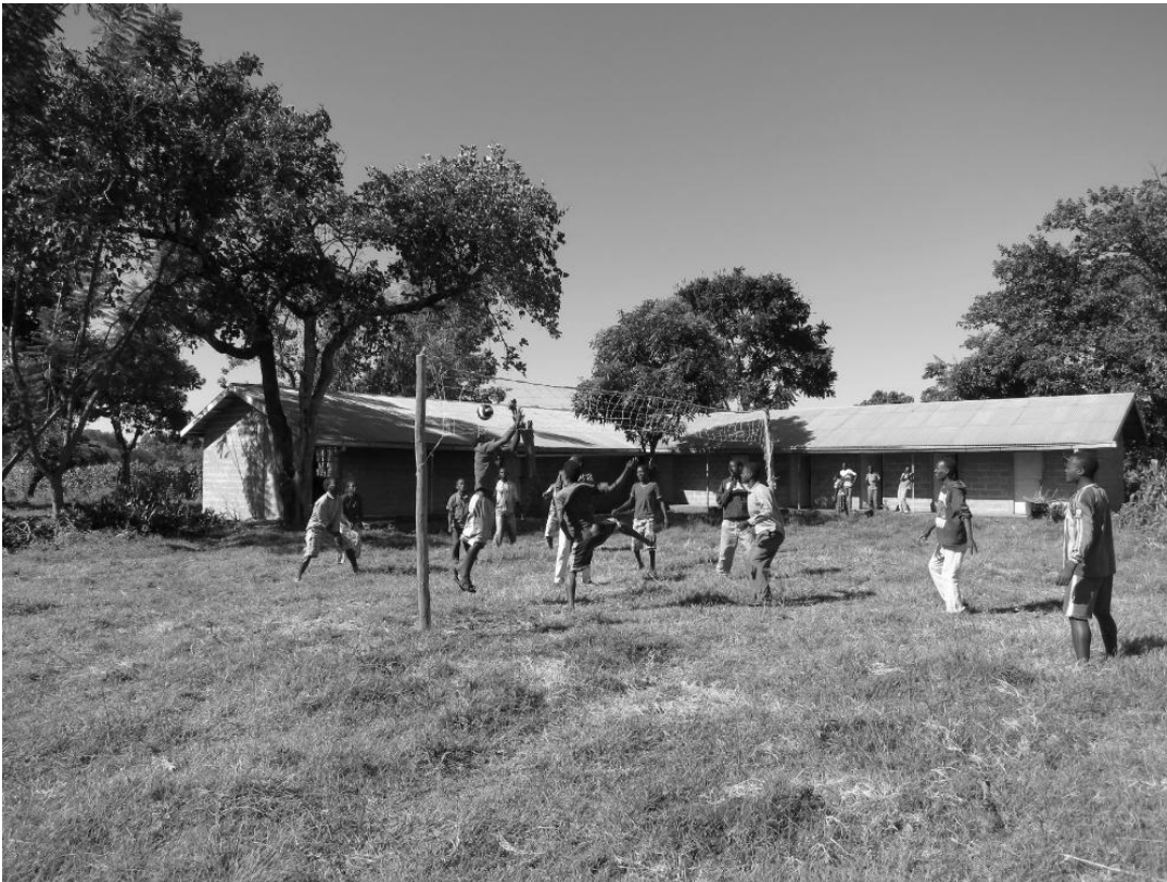
Billede af bibelskolen og elever, der spiller volleyball