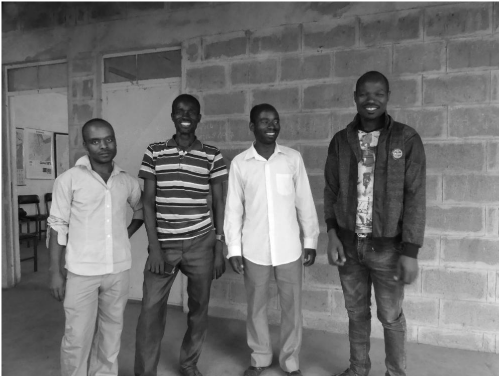
Billede af skolekomiteens medlemmer

I det sydvestlige hjørne af Etiopien er der omkring tyve forskellige stammer, og Mekane Yesus Kirkens bibelskole i Jinka har siden sin begyndelse i 2001 haft elever fra flere af disse stammer: ari, male, hammar, tsemago, daasanech, kara og også fra Konso og Gidole har der været elever.